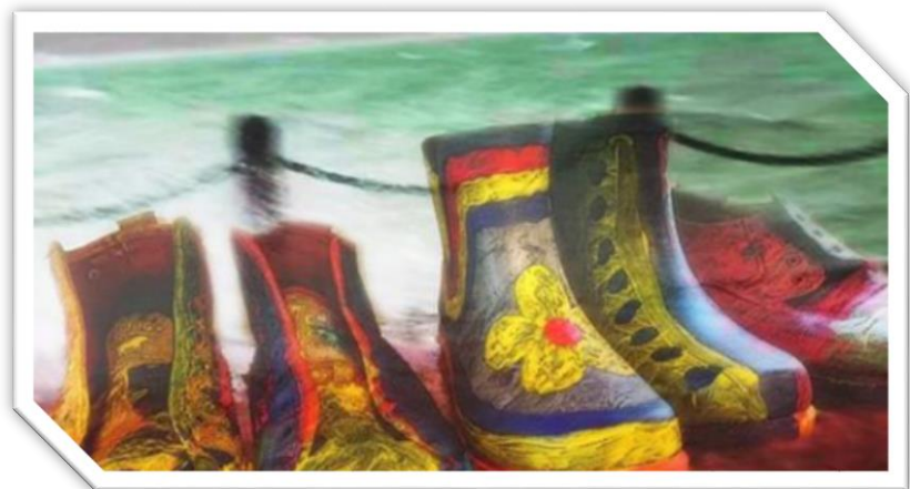
Fargerike sko i høstvær!